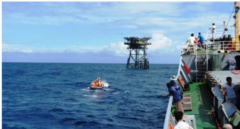
Tàu Hải quân đem quà xuân ra Nhà giàn DK1/11

“Một ba lô cây súng trên vai. Người chiến sỹ quen với gian lao”. Hành trang của người lính muôn đời vẫn là một tay súng, một chiếc ba lô, nhưng sự hy sinh và nỗ lực nhàn mà các anh đã trải qua thật khó nói hết bằng lời. Chiến tranh đi qua, cuộc sống của người lính biển đảo vẫn không một phút bình yên. Bởi ở nơi xa tiền tiêu Tổ quốc ấy, các anh đứng gác trong gió gào sương lạnh, làm nhiệm vụ thiêng liêng cao cả của mình để bảo vệ vùng trời vùng biển cho Tổ quốc.