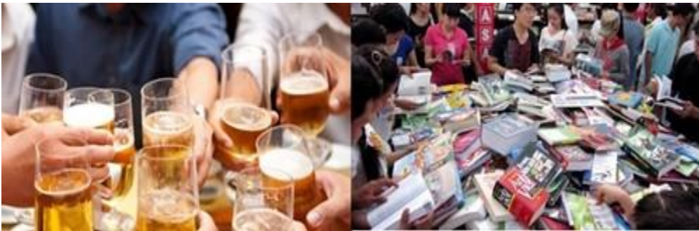
“Nhậu” nhiều, đọc ít và sự lên ngôi của văn hóa rẻ tiền

Người Việt chi ra 3 tỷ đô la để tiêu thụ 3 tỷ lít bia mỗi năm, nếu chia đều trên bình quân dân số mỗi người từ mới lọt lòng đến gần về thiên cổ sẽ “gánh” hơn 33 lít!. Một con số kinh hoàng, không sai nếu xếp bia rượu vào quốc nạn, nhớ ngày xưa Bác Hồ nói thực dân Pháp đầu độc dân tộc ta bằng rượu cồn... thì nay chúng ta đã tự mua cò đầu độc chính mình.