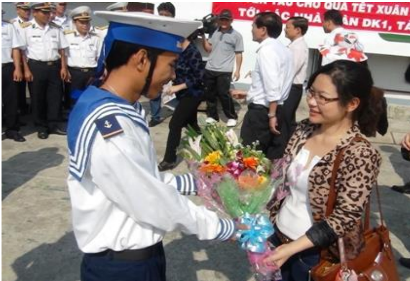
Niềm vui của chiến sĩ khi được khách đất liền ra thăm, chúc Tết

Còn bao chàng trai trẻ trong phút nhớ nhà, chỉ biết tâm sự với chính mình hay với sóng biển. Thế mới hiểu các anh trông đợi tin tức từ đất liền biết nhường nào. Nhiều khi cả hơn hai tháng mới có tàu thay trực. Nhận được thư người thân, lính đảo cứ truyền tay nhau đọc mà san sẻ niềm vui. Mỗi khi có đoàn ra giao lưu, các anh đều đón tiếp nồng nhiệt chân thành, để rồi bịn rịn lúc chia tay. Thời gian gặp nhau tuy ngắn ngủi, nhưng những lá thư xanh, dòng địa chỉ trao tay đã bù đắp phần nào nỗi cô đơn trong lòng họ.